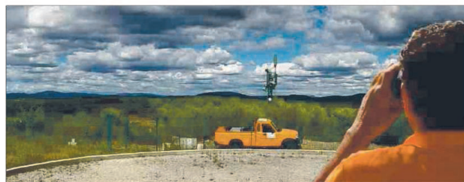
■ Vingt-neuf bénévoles ont assuré 201 heures de surveillance du haut de la vigie.

Dix-neuf volontaires ont patrouillé sur les 34 inscrits.